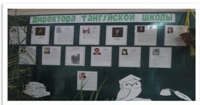
Директора Тангуйской школы