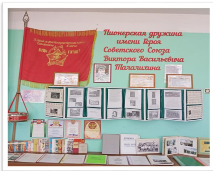
Уголок пионерской дружины имени Героя Советского Союза В.В. Талалихина