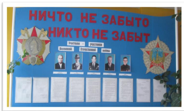
«Ничто не забыто, никто не забыт»