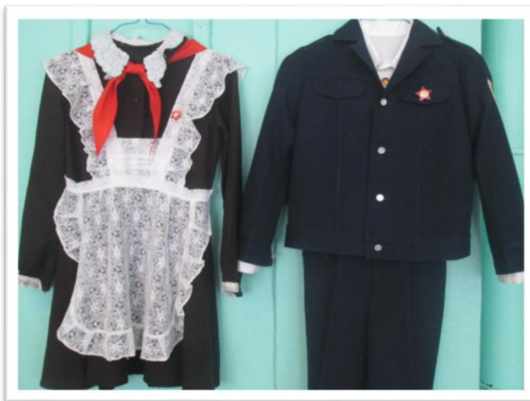
Школьная форма Советского периода