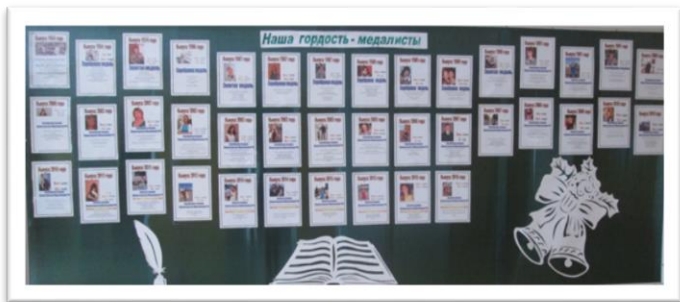
«Выпускники, окончившие школу с золотой и серебряной медалями»