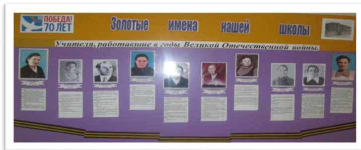
«Золотые имена школы»